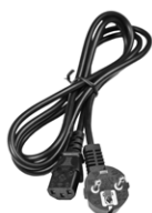
Przewód do ładowania akumulatorów (wtyk IEC C13)