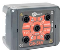
Skrzynka kalibra- cyjna CS-5 kV

WAPRZ003REBB10K WAPRZ005REBB10K WAPRZ010REBB10K WAPRZ020REBB10K