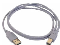
Przewód do transmisji danych USB