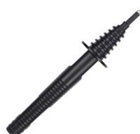
Sonda ostrzowa 11 kV (gniazdo bananowe) czarna